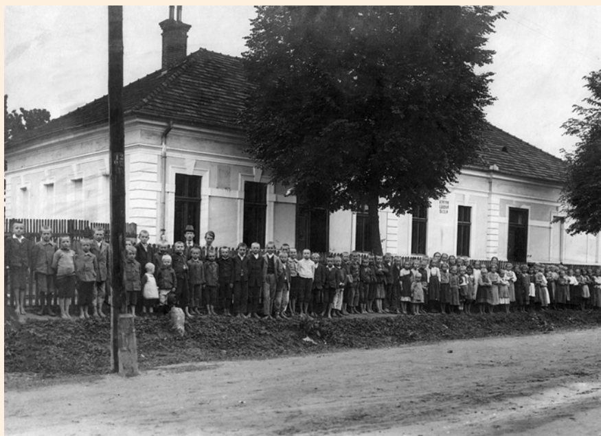
(Na fotografii žiaci na konci školského roka 1919 – 1920)

Slávnostný deň prvého slovenského vyučovania v obci bol 16. september 1919. Potom sa robili rôzne technické opatrenia na zlepšenie vyučovacích podmienok, kúpili prvý československý prapor, obrazy a iné.