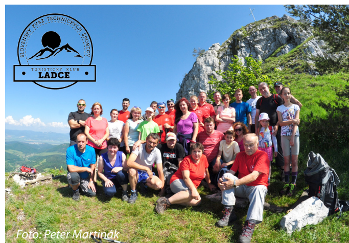
Ladecskí turisti - výstup na Vápeč, 26. máj 2018.