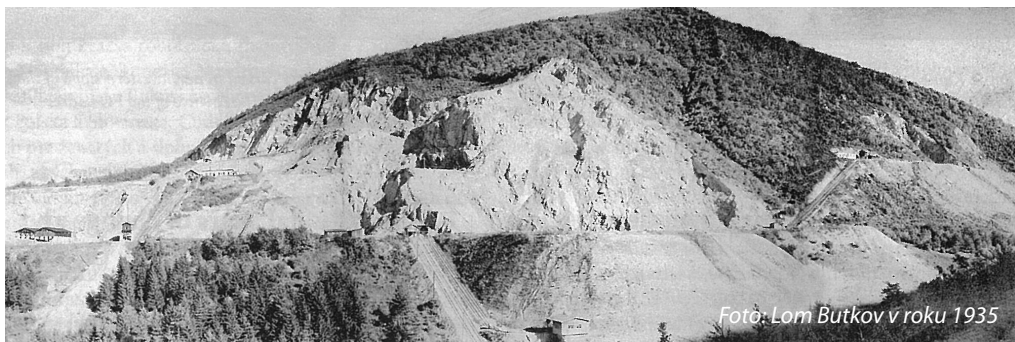
Foto: Lom Butkov v roku 1935

Butkov – častá téma pre vedcov, technikov, mínerov, strojníkov, laborantov, robotníkov. Ladčiansky lom – zdroj kvalitného vápenca na kvalitný portlandský cement sa neustále mení. Za relatívne krátky čas jeden a štvrt storočia i v reláciách desiatok miliónov rokov. Zažil čas diluviálneho mora, časy dobývania obyčajnými nástrojmi i modernými mechanizmami, železničku ťahanú koníkmi aj moderný dopravník.